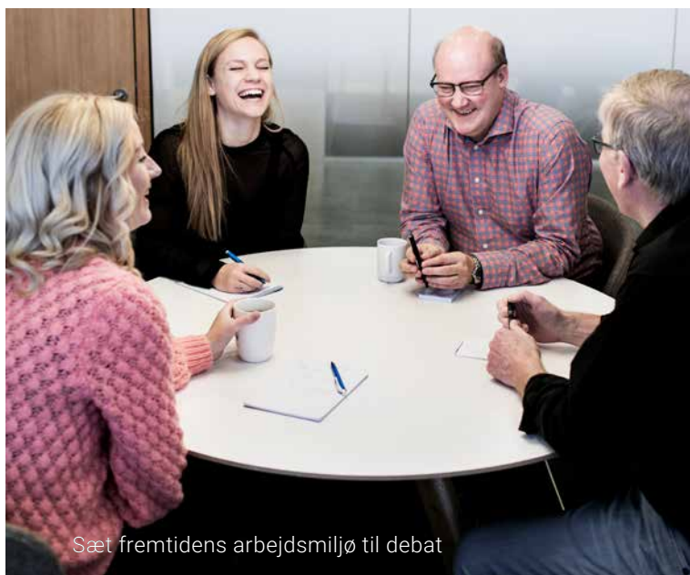
Sæt fremtidens arbejdsmiljø til debat

Under hvert tema sondres der mellem, hvad det betyder for henholdsvis de særligt berørte (fx seniorer eller løst tilknyttede) og for arbejdspladsens arbejdsmiljø.